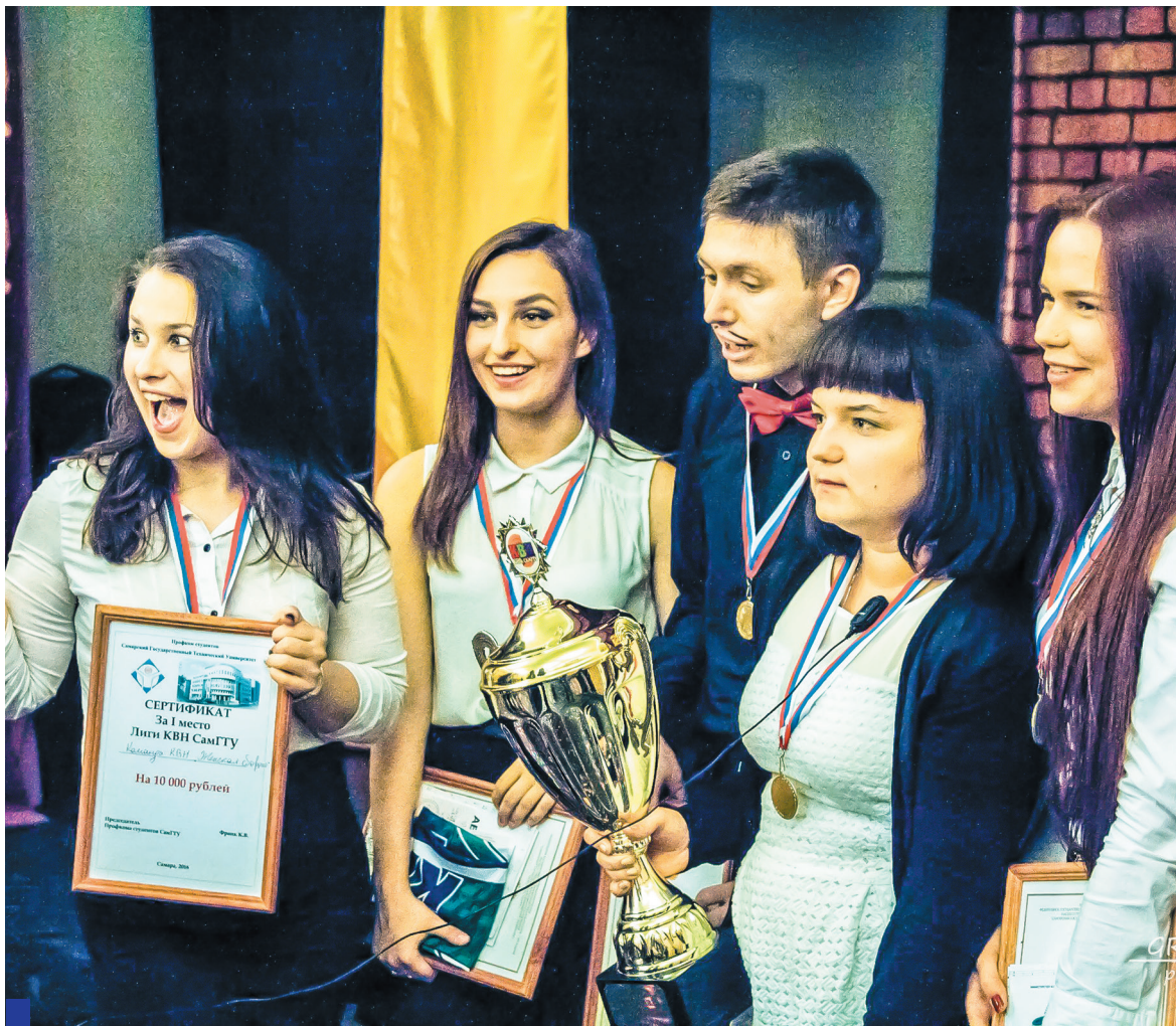
«Женская сборная» получила кубок победителя и сертификат на 10 000 рублей.