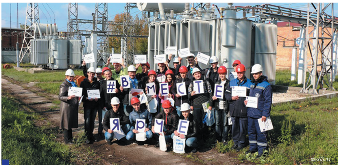
Профориентация для студентов ЭТФ проходила в увлекательной форме.