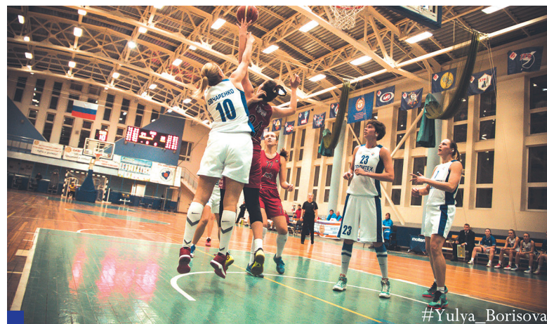
Первые матчи чемпионата задали тон игре наших баскетболисток.

БК «Политех – СамГТУ» отличился в первом туре чемпионата Суперлиги