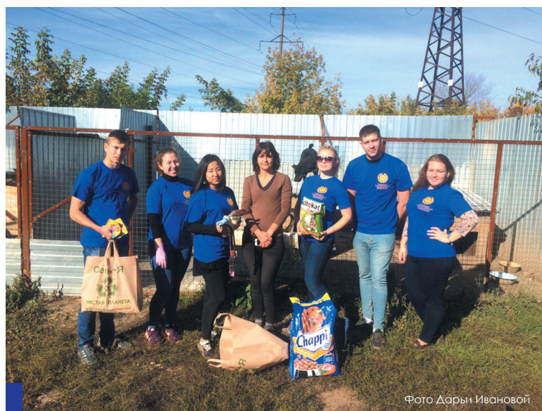
Поездки в приюты для животных становятся у студентов Политеха доброй традицией.

– В приюте обитают преимущественно дворняжки, которые